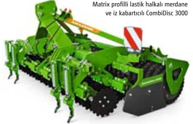
Matrix profilli lastik halkalı merdane ve iz kabartıcılı CombiDisc 3000

Çalışma genişliği 3 m olan asılır tip kompakt diskli kültivatör CombiDisc, özellikle Cataya veya Centaya gibi monte edilebilir tipteki bir ekim makineleri ile yüksek sürüş hızlarında ekim yapmak için idealdir. 3 cm ila 8 cm çalışma derinlikleri ile ideal bir tohum yatağı oluşturulur. Geniş yelpazeli merdane programı, toprağın sıkıştırılması için her toprak türüne en uygun merdaneyi sunar.